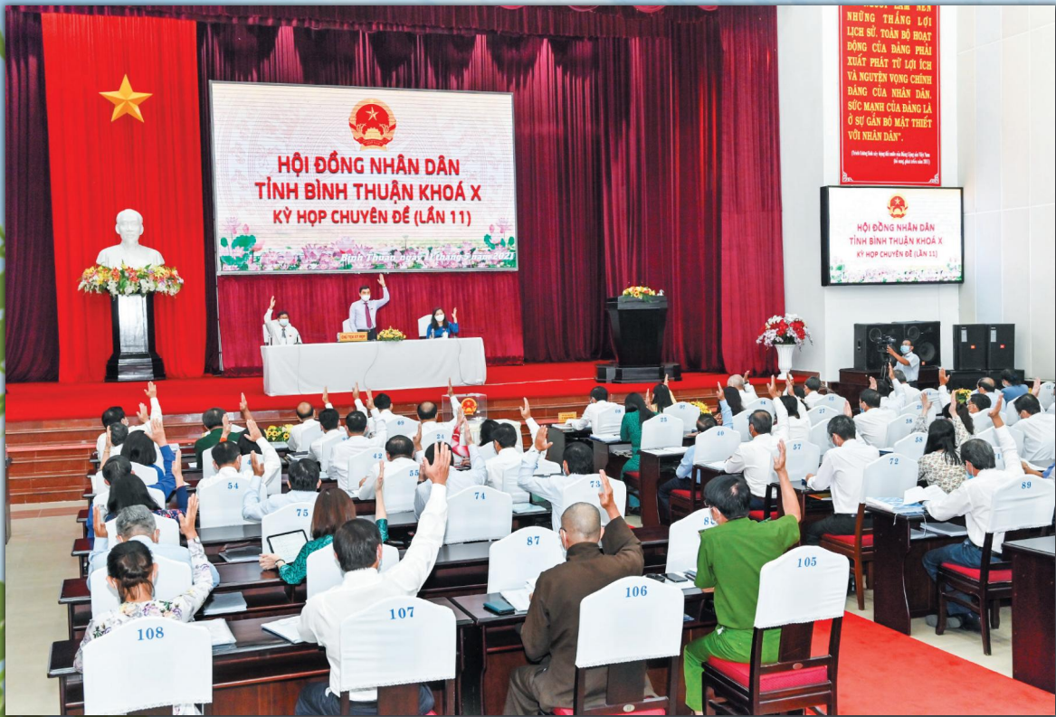
Hội đồng Nhân dân tỉnh Bình Thuận Khóa X, kỳ họp chuyên đề (lần 11).