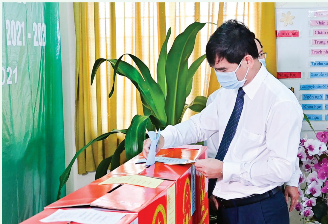
Đồng chí Dương Văn An - Ủy viên Trung ương Đảng - Bí thư Tỉnh ủy bỏ phiếu Bầu cử tại phường Hưng Long, thành phố Phan Thiết.