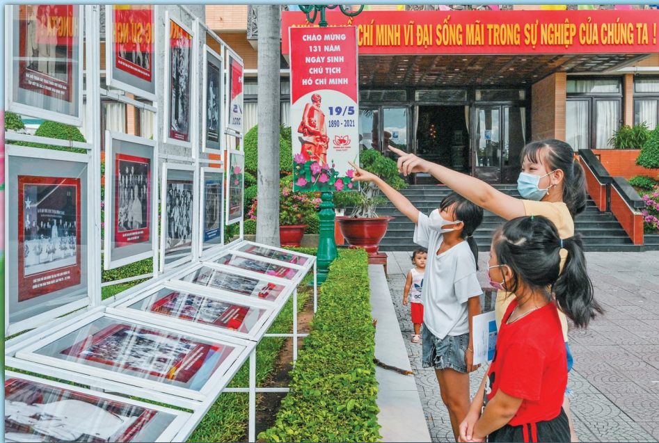
Các cháu thiếu nhi với triển lãm tranh về sự nghiệp và thân thế Chủ tịch Hồ Chí Minh tại Khu Di tích Dục Thanh.