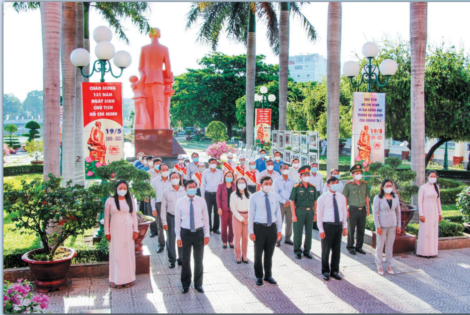
Lãnh đạo tỉnh viếng Chủ tịch Hồ Chí Minh nhân kỷ niệm 131 năm ngày sinh của Người tại Khu Di tích Dục Thanh.